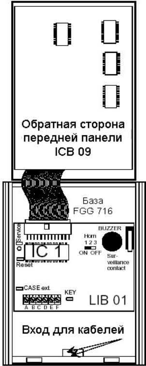
Рис. 3 Конфигурация PIM 732 и FG 716